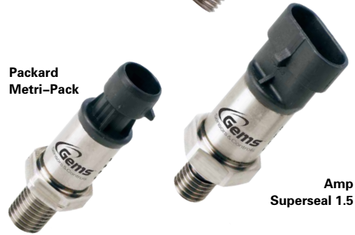
Amp Superseal 1.5