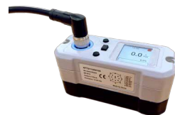
XFT 超声波流量传感器