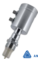
ILM-4 在线电导率传感器

制冷回路里流动的制冷剂化学和物理特性会随着时间的推移而发生变化，这不但会影响导热性能，还会对管路中的零部件寿命造成影响。