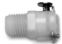
1/4" NPT带单向阀的配对接头