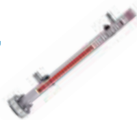
小尺寸SureSite®合金型 磁翻板液位计