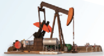
石油和天然气 所有条件下都能够高亮指示液位