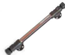
SureSite®工程塑料型 磁翻板液位计