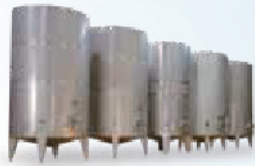
大型储油罐 可提供最大10英尺型号