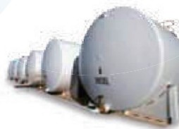
发电机燃料箱 阳光直射下LED灯依然可见