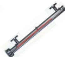
SureSite®标准合金型 磁翻板液位计