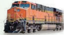
柴油机车 可靠耐受振动