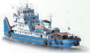
商用船舶 适应甲板下安装和工作