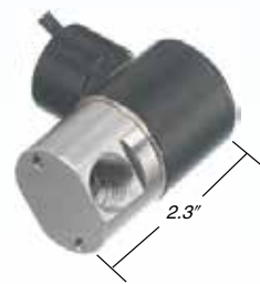
B-Cryo系列电磁阀恰好符合当今小型机器的需求。

外形紧凑，专为极端温度应用设计，适用于低至-320°F (-196°C) 的温度条件。