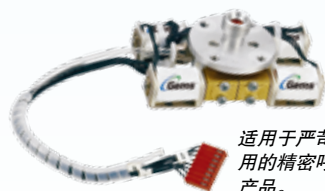
适用于严苛医疗应用的精密呼吸控制产品。

在呼吸机等产品中精确输气应用中，流体控制起着重要的作用。这类设备需要一系列不同的流体监控和管理。GEMS 压力及电磁阀产品提供整体解决方案。