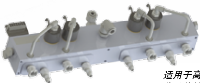
适用于高风险医疗设备的可靠流体控制产品。